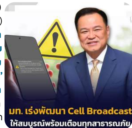
มท. เร่งพัฒนา Cell Broadcast ให้สมบูรณ์พร้อมเตือนทุกสาธารณภัย

ยกระดับประสิทธิภาพระบบเตือนภัยของประเทศโดยได้จัดทำมาตรฐานการปฏิบัติงาน (SOP) และมาตรฐานข้อความแจ้งเตือนภัย (CAP) ผ่านระบบ Cell Broadcast Service (CBS) ครอบคลุมภัยพิบัติหลักแล้ว 8 ประเภท และอยู่ระหว่างขยายผลเพิ่มเติมอีก 6 ประเภท ควบคู่กับการขยายเครือข่ายเฝ้าระวังผ่านโครงการพัฒนาและติดตั้งหอเตือนภัยพร้อมอุปกรณ์โทรมาตร ซึ่งปัจจุบันครอบคลุมพื้นที่ 592 แห่งทั่วประเทศ และเตรียมติดตั้งเพิ่มอีก 12 แห่ง ในปีงบประมาณ พ.ศ. 2569 นอกจากนี้ ยังได้พัฒนาแอปพลิเคชัน “DPM Alert” เพื่อให้หน่วยงานและประชาชนสามารถติดตามข้อมูลคาดการณ์สภาพอากาศล่วงหน้า ข้อมูลโทรมาตรและสิ่งแวดล้อม ตลอดจนรองรับการรับข้อความเตือนภัยฉุกเฉินจากระบบ Cell Broadcast Entity (CBE) ตามมาตรฐาน CAP ได้โดยตรง ซึ่งช่วยเพิ่มขีดความสามารถในการเตรียมความพร้อมรับมือสถานการณ์ฉุกเฉินได้อย่างแม่นยำและทันทั่วถึง